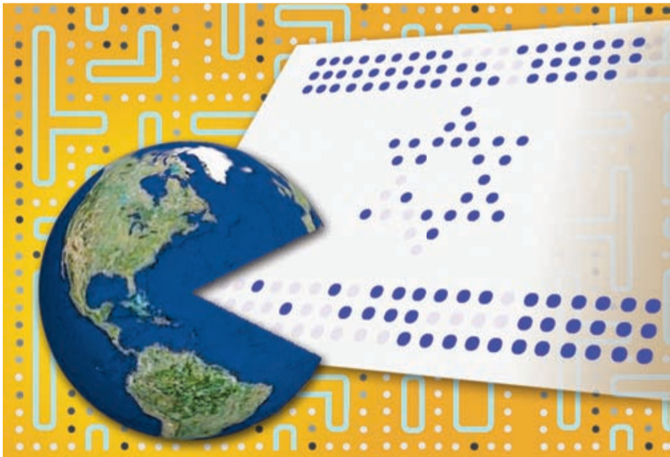
איור ממוחשב. ענבל דוד

חותר קדימה בצורה אישית, עברנו למצב שבו כולנו תלויים לחלוטין זה בזה. ומה זה אומר בדיוק? שפתאום האגואיזם - או במילים אחרות, המחשבה על עצמי בלבד - הפך לבעיה. למה? כי אנחנו ממשיכים להתנהג בצורה אגואיסטית, למרות שאנחנו חיים במערכת אחת סגורה. ובמערכת סגורה, כמו במערכת סגורה - כל פעולה שלך משפיעה על אחרים, אבל גם חוזרת אליך כמו בומרנג (מישהו אמר משבר כלכלי?).