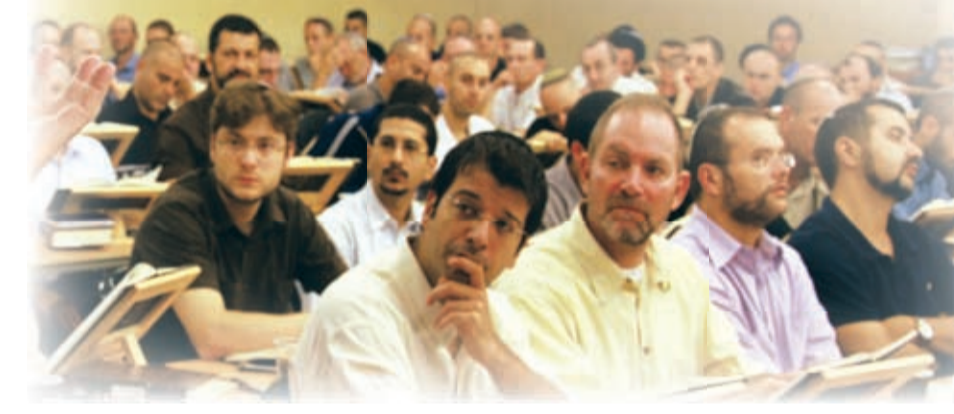
ארבע לפנות בוקר, הרב לייטמן וקבוצת המקובלים "בני ברוך" בשיעור הקבלה היומי

לא במקרה החיים שלנו נעשים יותר ויותר קשים. המטרה מאחורי הקושי הזה היא לדחוף אותנו לשאול את השאלה הזו. וזו לא סתם שאלה תיאורטית או פילוסופית. אם מתעוררת באדם שאלה על משמעות חיו, זה כבר סימן לכך, שהוא יכול וצריך לצאת