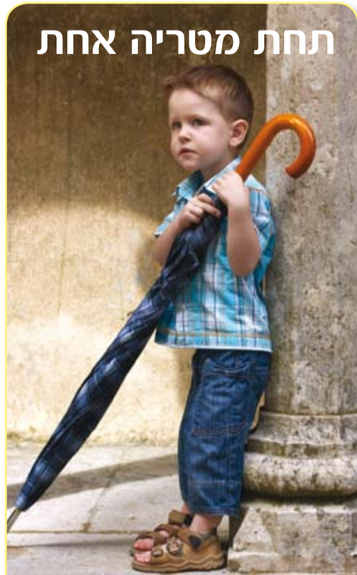
תחת מטריה אחת