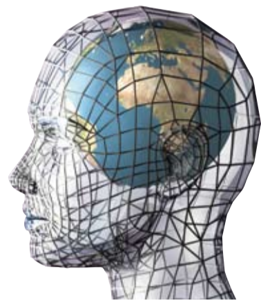
■ מאת: גלעד שדמון

מהי המציאות? כיצד אנו תופסים אותה? האם היא קיימת גם ללא תלות בנו, או שמא היא תמונה שמצטיירת בתוכנו ותלויה בתכונותינו הפנימיות? לכאורה, מי אינו יודע מהי המציאות?! הרי היא כל הנראה לעין - הבתים שמסביב, האנשים, היקום כולו. המציאות היא מה שאפשר למשש ולגעת בו, מה ששומעים, טועמים ומריחים. זוהי המציאות. מה, לא?!