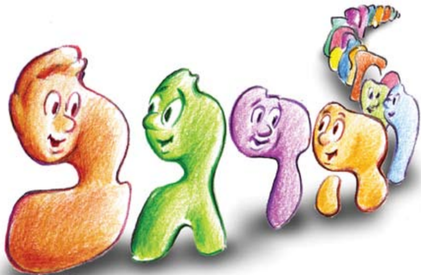
איור: מיכאל גונופולסקי

לצפייה בקורס "סוד האותיות": www.kab.co.il/183